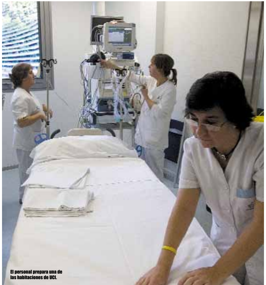
El personal prepara una de las habitaciones de UCI.

Instalazio berriei esker, pazienteek eta haien senideek konfidentziasun eta pribatutasun handiagoa izateko aukera izango dute.