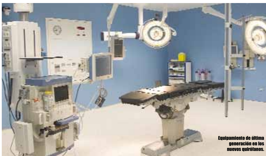
Equipamiento de última generación en los nuevos quirófanos.