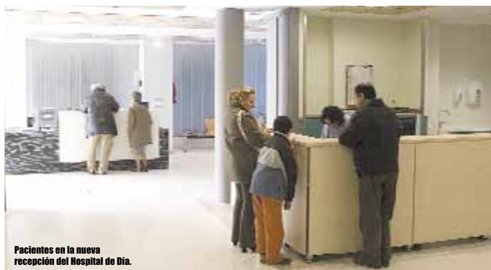
Pacientes en la nueva recepción del Hospital de Día.