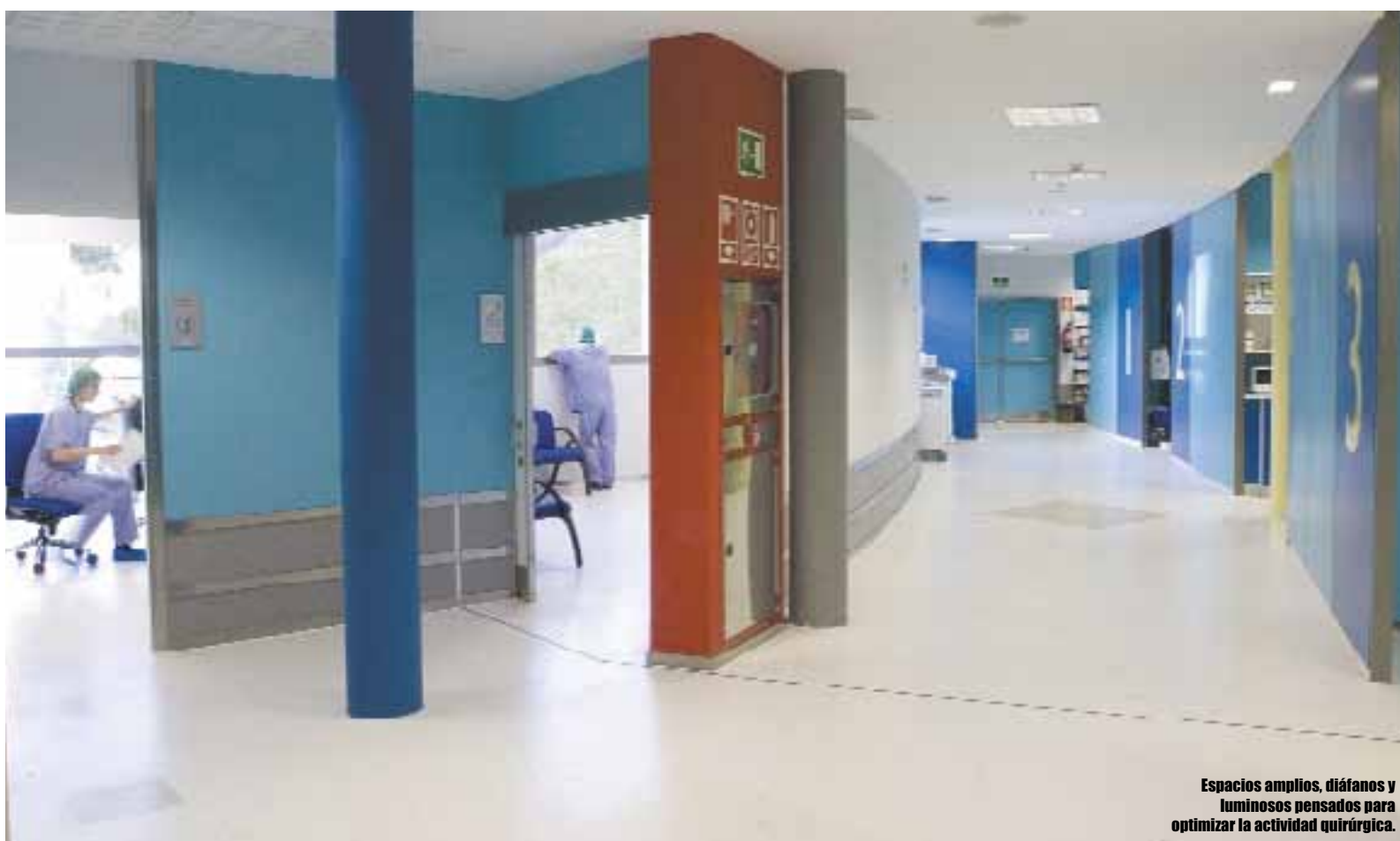
Espacios amplios, diáfnos y luminosos pensados para optimizar la actividad quirúrgica.