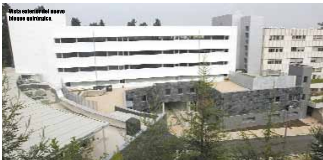
Vista exterior del nuevo bloque quirúrgico.

Zirujauk eskuen bidez edo ahotsaren bidez kontrolatzen dituzte ebakuntza-gela osatzen duten tresna kirurgikoak eta ekipamenduetako posizio guztiak.