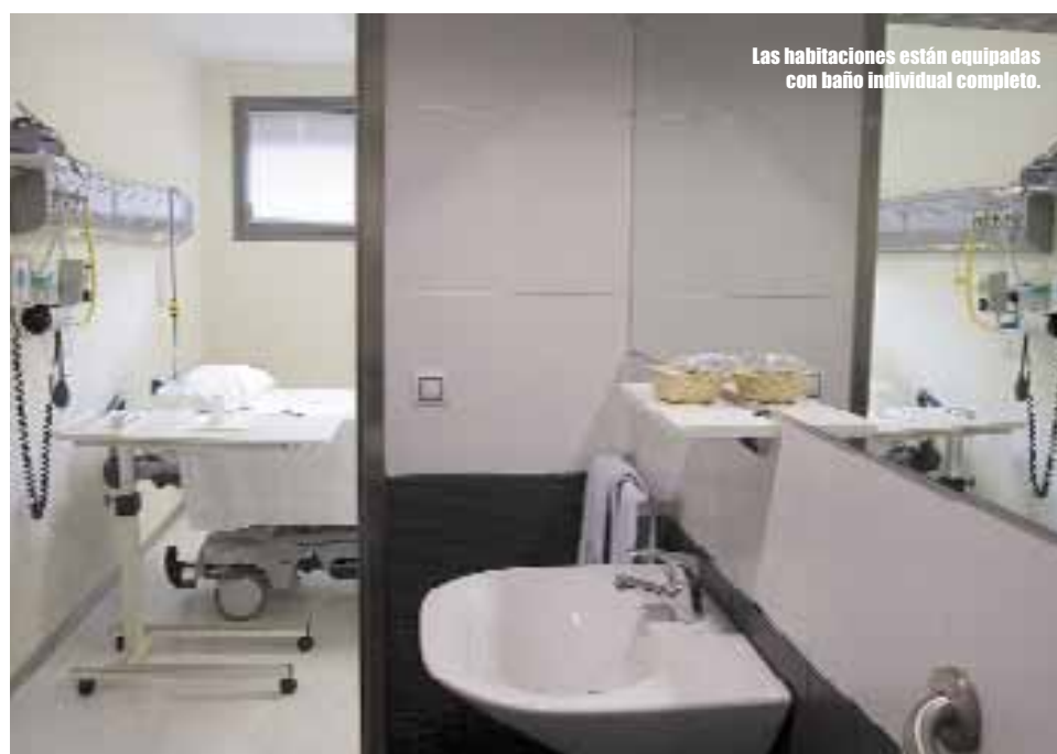
Las habitaciones están equipadas con baño individual completo.