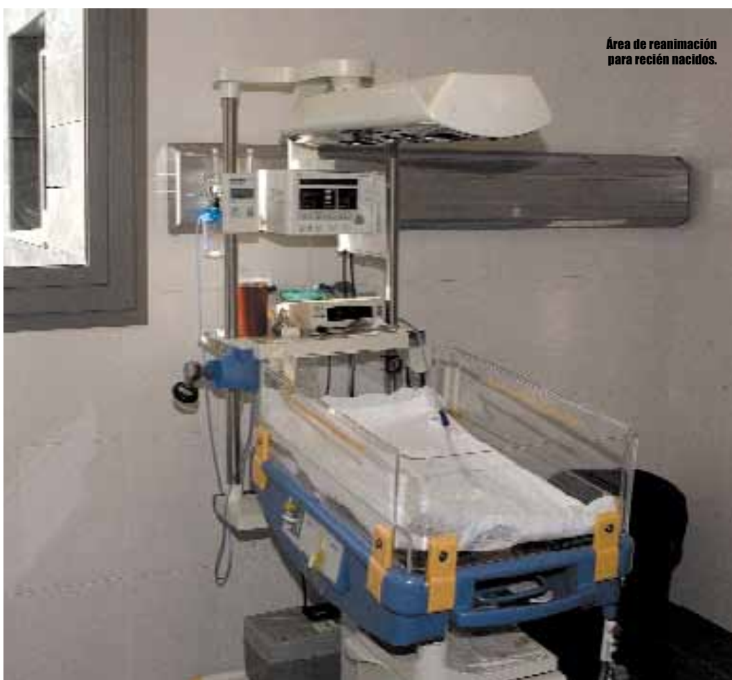
Área de reanimación para recién nacidos.

La Zona Obstétrica se completa con una moderna Unidad de Reproducción Asistida en la que se aplican las técnicas de fecundación In Vitro ■