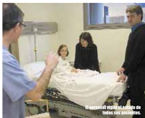
El personal vigila el estado de todos sus pacientes.