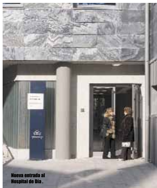
Nueva entrada al Hospital de Día.

Después de una cirugía de este tipo, el paciente sólo permanece unas horas en observación hasta que recibe el alta médica. Al día siguiente, el equipo del Hospital de Día hace un seguimiento telefónico del estado de todos los pacientes ■