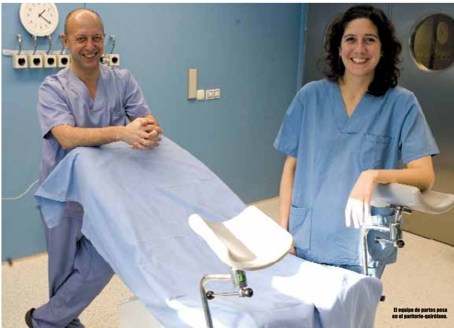
El equipo de partos posa en el paritorio-quirófano.