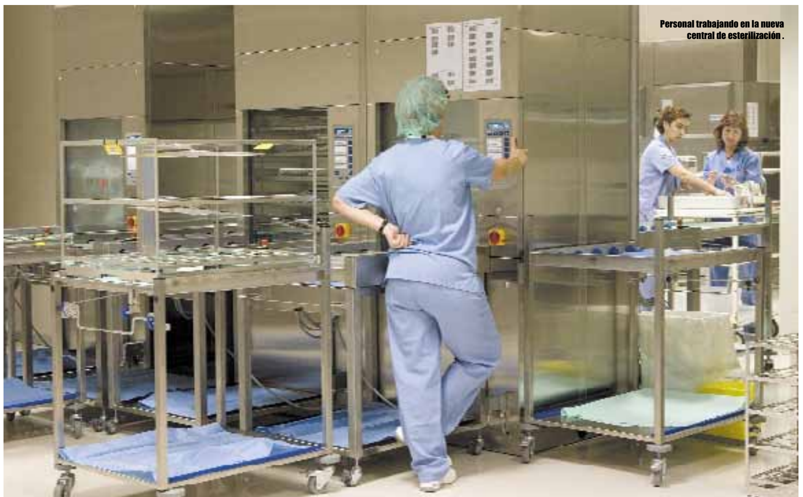
Personal trabajando en la nueva central de esterilización.