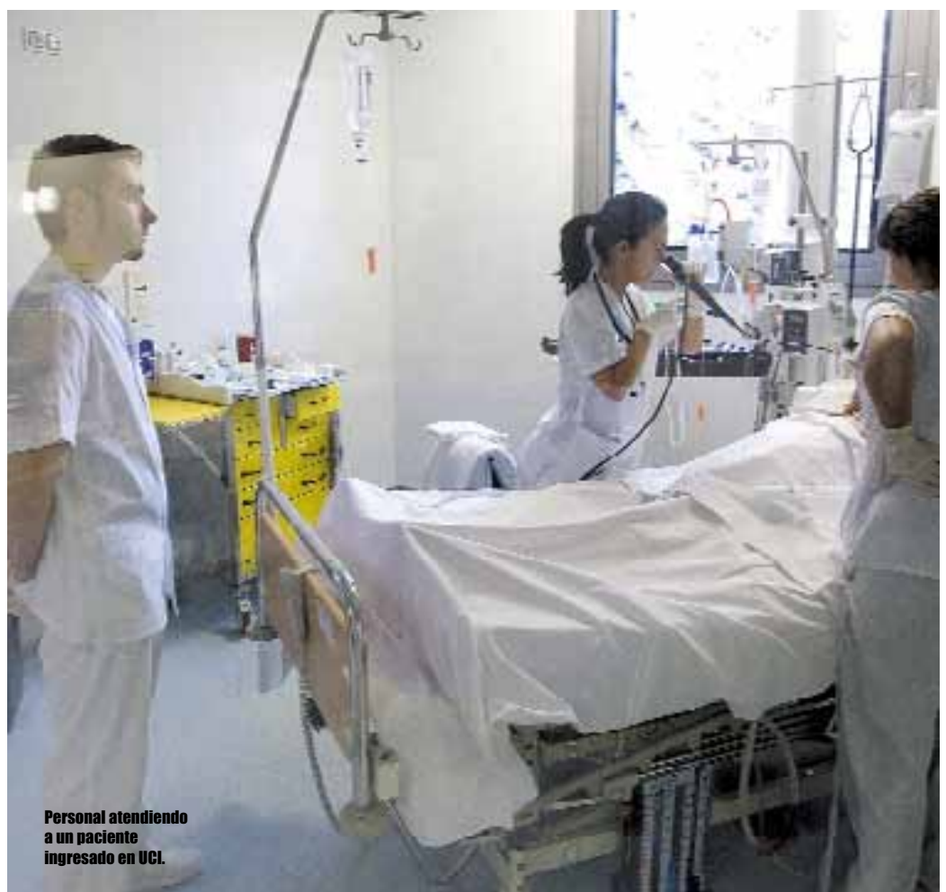
Personal atendiendo a un paciente ingresado en UCI.